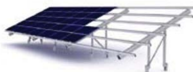
Conergy SolarLinea 5 σειρών